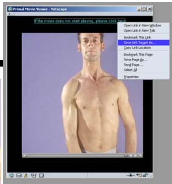
図 4 (Netscape)